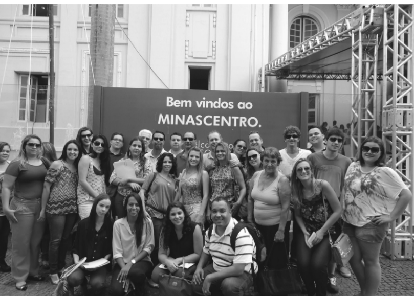
Participantes de Campo Belo e Formiga na Feira do Empreendedor