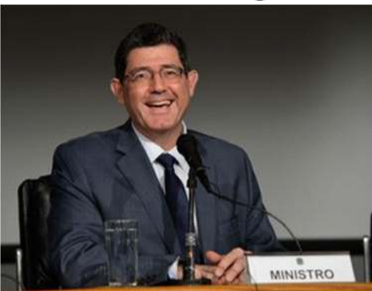
O Ministro da Fazenda, Joaquim Levy

Ministro citou a necessidade de cortar subsídios para ajustar economia. Recentemente, governo endureceu o acesso a benefícios previdenciários