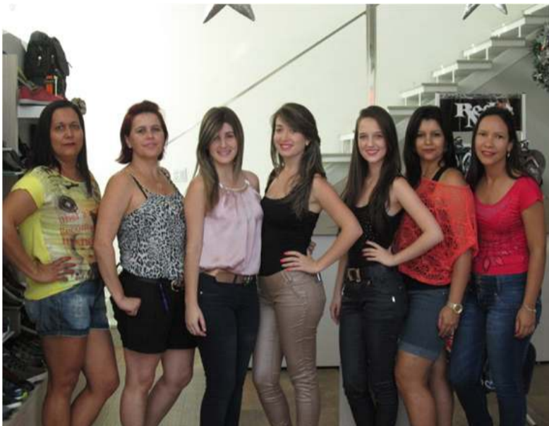
Equipe da Loja Sônia Store