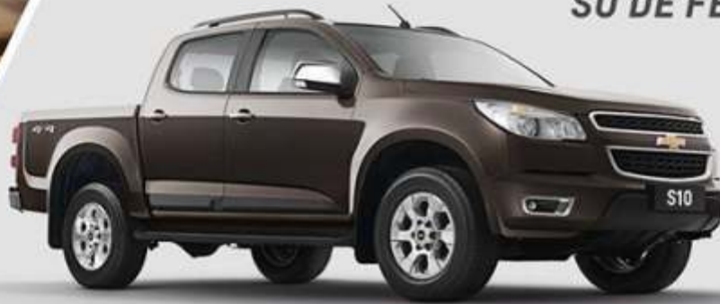
NOVA CHEVROLET S10.

A TECNOLOGIA NÃO VAI PARA O CAMPO SÓ DE FÉRIAS.