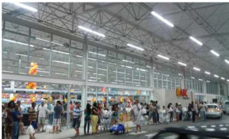
22/01/15 - Inauguração da Loja Hiper ABC Campo Belo

Este espaço é totalmente gratuito. Se a sua empresa tem alguma novidade para divulgar, mande-nos um e-mail através do site: www.acecb-mg.com.br e agende uma visita de um de nossos colaboradores.